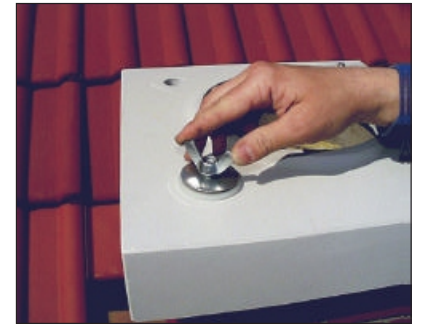
15. Završnu ploču učvrstite krilnim maticama.