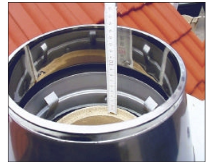
18. Postavite konusni nastavak i izmjerite potrebnu dužinu zadnje šamotne cijevi.