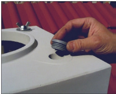
16. Neupotrebne otvore pokrijte plastičnim čepovima.