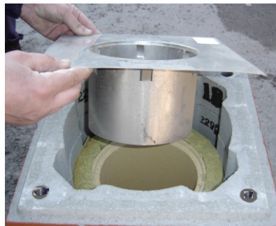
10a. Postavite dilatacionu rozetu.