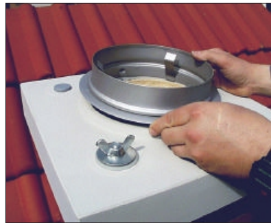
17. Namjestite distancioni prsten na završnu ploču.