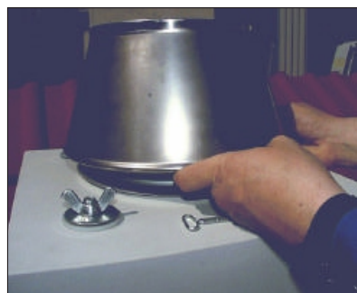
20. Namjestite konusni nastavak.