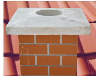
11a. Po nanošenju maltera na zadnji UNI FINAL element i dilatacionu rozetu postavite završnu betonsku ploču.