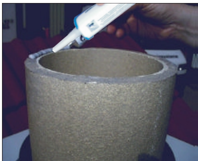
19. Nanesite RAPID KIT na vrh zadnje keramičke cijevi.