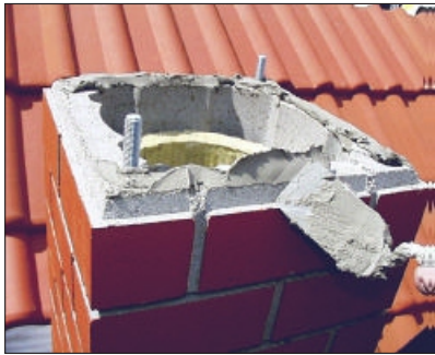
13. Nanesite malter na zadnji element UNI FINAL: