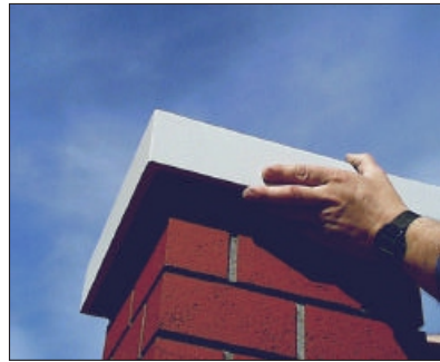
14. Namjestite završnu betonsku ploču.