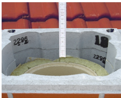
9a. Toplotnu izolaciju i zadnju cijev odrežite 6 cm ispod vrha zadnjeg elementa UNI FINAL.